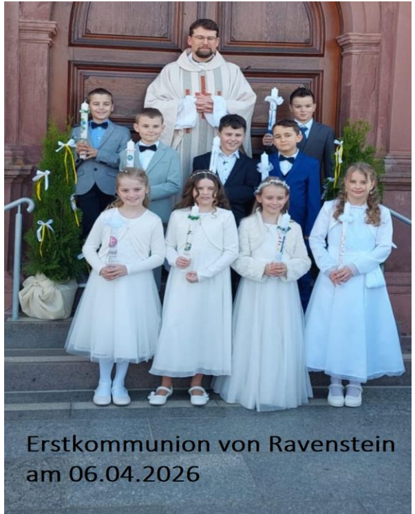
Erstkommunion von Ravenstein am 06.04.2026

Wir gratulieren allen Kindern, die in diesem Jahr zum ersten Mal die Heilige Kommunion empfangen haben.