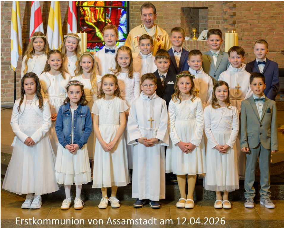
Erstkommunion von Assamstadt am 12.04.2026