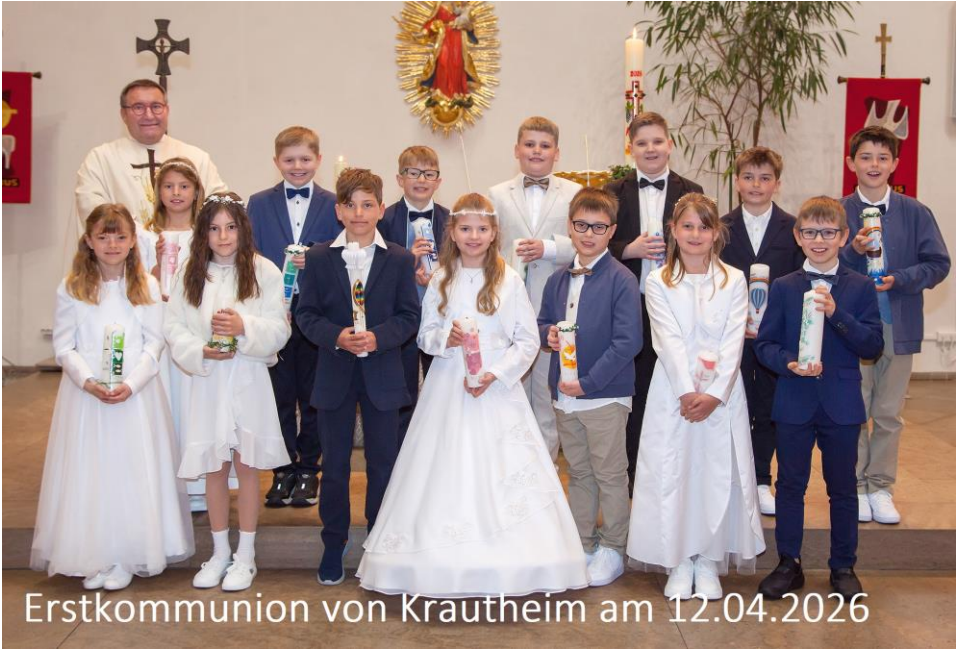
Erstkommunion von Krautheim am 12.04.2026