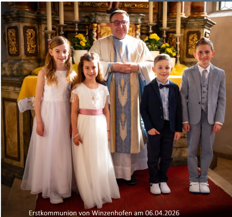
Erstkommunion von Winzenhofen am 06.04.2026

Wir sagen ein herzliches Dankeschön an die Eltern, die sich aktiv bei den Vorbereitungsstunden, den Gottesdiensten und den vielen Dingen, die oft unbeachtet bleiben, eingebracht haben.